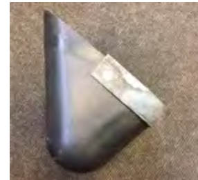
Nylathane™-Becher mit einer angeschraubten abrasionsbeständigen Stahllippe (Seitenansicht)

Bei einem anderen industriellen Einsatzbereich (Befördern von Bruchglas), konnte der Anlaufstrom durch den Austausch der schweren Stahlbecher mit den leichteren Nylathane™-Becher um fast 80 % reduziert werden. Das spart sowohl Energie als auch Kosten für elektronische Komponenten. Die Installation der leichteren Nylathane™-Becher war auch schneller und sicherer und dauerte nur einen Tag gegenüber von drei Tagen bei den Stahlbechern.