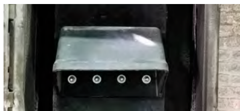
Nylathane™-Becher in einem Glasbruch-Elevator installiert.