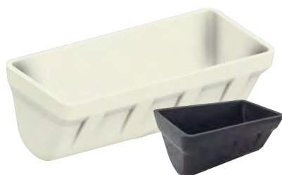
4B AA NYLATHANE™