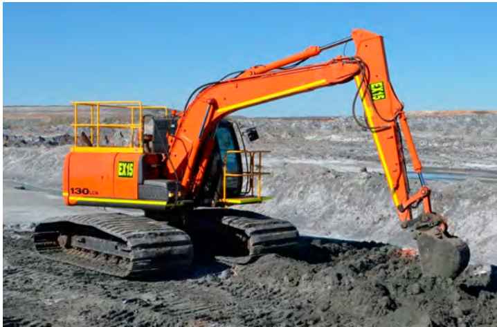
Einsatz von Nylathane™-Bodenplatten an einem Bagger

Das Design von industriellen Elevatorbechern hat sich seit den 1950er-Jahren nicht wesentlich verändert. Allerdings bringt die Einführung von Nylathane™ der 4B Group eine neue Technologie auf den Markt. Nylathane™ ist ein einzigartiges Polymer, das Nylon 6 mit einem Elastomer kombiniert. Es verfügt über die Langlebigkeit von Nylon und eine glatte Oberfläche, die mit Polyurethan in Verbindung gebracht wird. Diese Kombination macht es ideal für Elevatorbecher in der Zementindustrie, wo hohe Stoßfestigkeit und ein effizienter Auswurf von klebrigen oder pudrigen Schuttgütern erforderlich sind, um Ausfallzeiten zu minimieren und die Produktionseffizienz zu steigern. Vor der Verwendung in Elevatorbechern hat sich Nylathane™ vielfach in noch anspruchsvolleren Einsatzgebieten wie bei Bodenplatten für Traktoren bewährt.