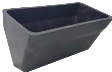
4B AC NYLATHANE™