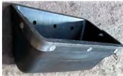
Nylathane™-Becher mit einer angeschraubten abrasionsbeständigen Stahllippe (Vorderansicht)