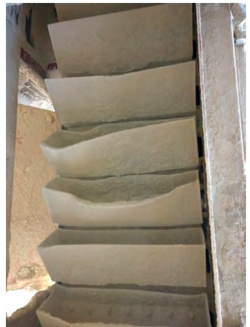
Verformte und gebrochene Metallbecher

Eisen- oder Stahl-Elevatorbecher sind aufgrund von äußerlichen Einflüssen oder betrieblichen Aspekten anfällig für Verformungen oder Bruch. Wenn sie verformt sind, haben sie eine geringere Kapazität und Effizienz. Verformte Elevatorbecher stellen ein Risiko dar, das System des Becherwerks weiter zu beschädigen, wenn sie sich durch das System bewegen. Die Handhabung von schweren Eisen- oder Stahl-Elevatorbechern erweist sich als schwierig, wenn sie repariert oder ersetzt werden. Aufgrund des Energiebedarfs, der benötigt wird, um die schweren Bauteile des Bechers zu bewegen, belastet ihr Gewicht auch die Effizienz des Systems. Löst sich ein Becher von dem Elevatorgurt oder der -kette, ist der zusätzliche Schaden im System massiv. In bestimmten Einsatzbereichen können einige Metalle mit der Zeit spröde werden. Klebrige Pulver sammeln sich häufig in Metall-Elevatorbechern an, wodurch sich ihre Kapazität verringert und Entlüftungs-/ Entwässerungslöcher verstopfen. Mit Nylathane™-Elevatorbechern werden diese Probleme behoben.